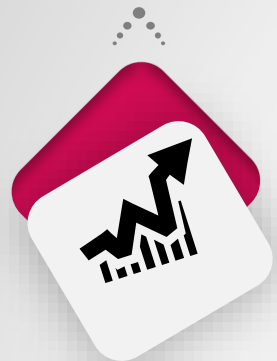
نمودار رضایت سنجی کارکنان از معاونت توسعه منابع انسانی در سالهای ۹۵-۹۶